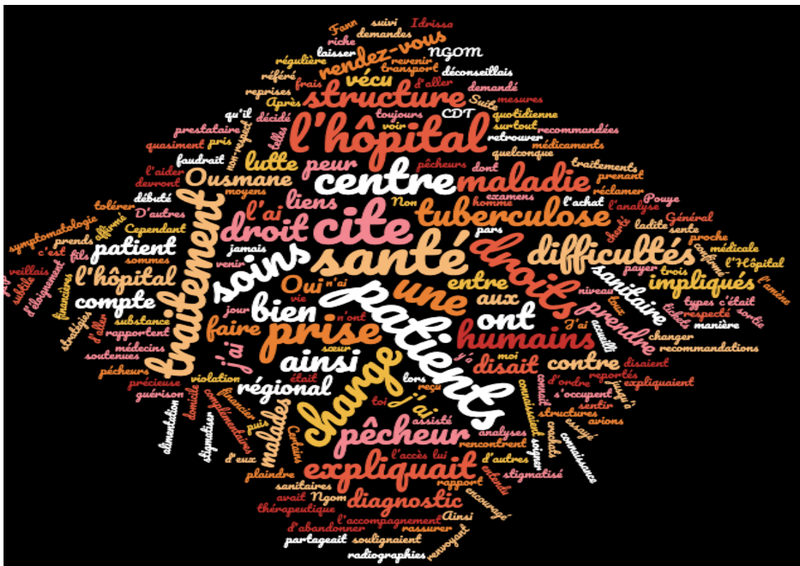
Figure 7 : Nuage de mots des propos des pêcheurs